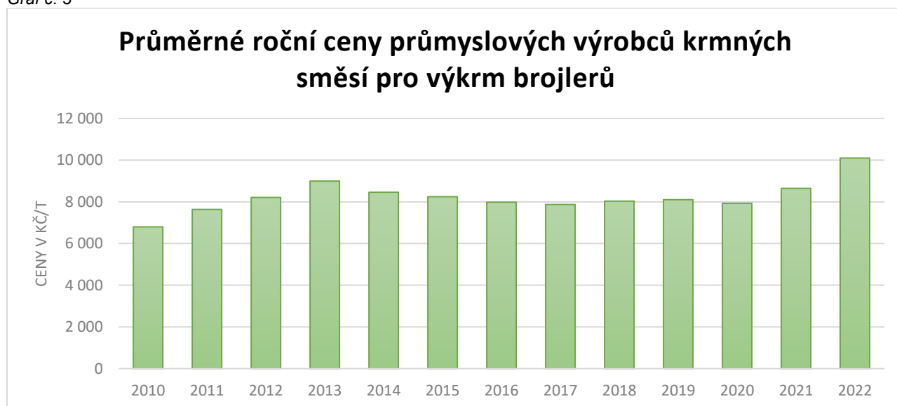
Graf č. 3