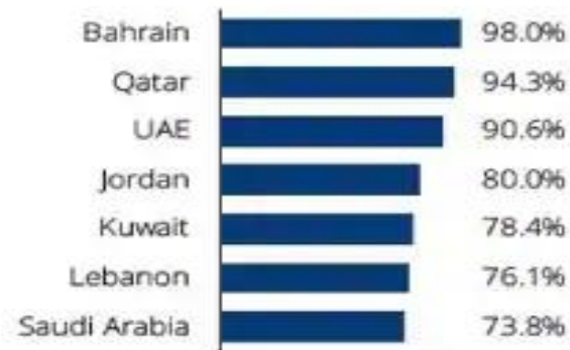
Figure 1: Internet Penetration by Country, June 2017