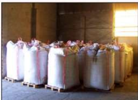
Sušená plná krev