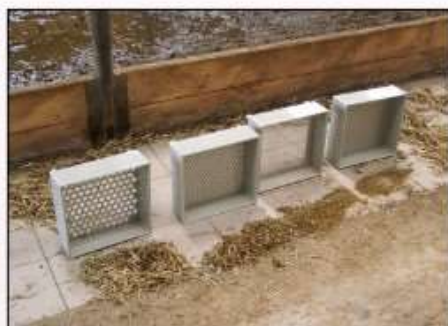
Síta pro stanovení jednotlivých frakcí krmiv