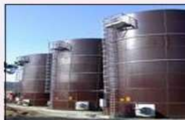
Skladování kapalných hnojiv