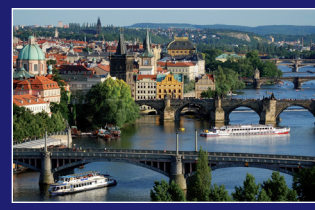
► Protipovodňová opatření v Praze na Vltavě ► Hochwasserschutzmaßnahmen in Prag an der Moldau