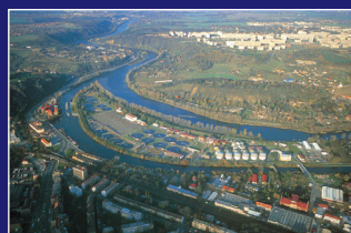
► Ústřední čistírna odpadních vod v Praze ► Zentrale Kläranlage in Prag