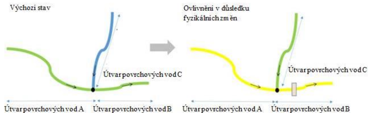
Obr. č. 1 Posuzování vlivu záměru na ostatní útvary povrchových vod

Obrázek č. 1 ilustruje příklad nové změny fyzikálních poměrů vodního útvaru (např. v důsledku navrhované přehrady ve vodním útvaru B), která bude mít za následek zhoršení ekologického stavu. Navazující útvary povrchových vod (A a C) jsou rovněž ovlivněny (např. z důvodu ovlivnění průchodnosti a důležitých biotopů), což vede ke zhoršení ekologického stavu útvarů A a C.