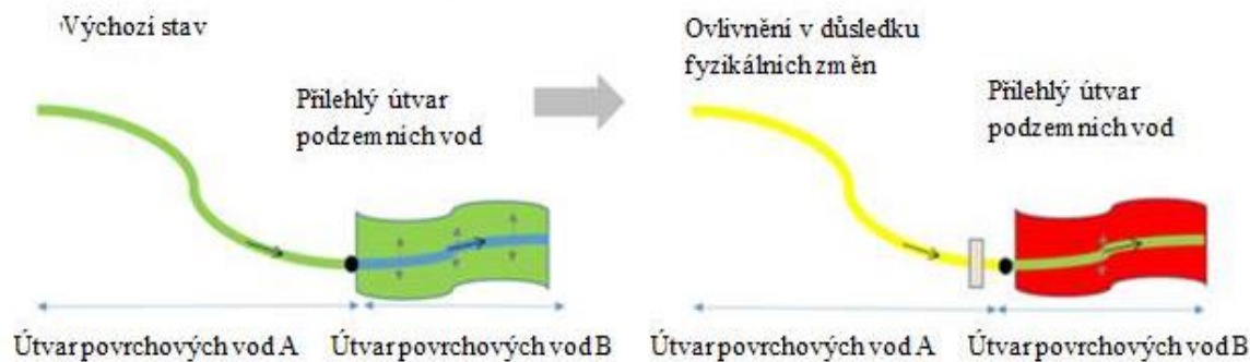
Obr. č. 2 Posuzování vlivu záměru na dotčené útvary podzemních vod

Nová změna fyzikálních poměrů v útvary povrchových vod může mít za následek i zhoršení stavu souvisejícího útvaru podzemních vod (viz obrázek č. 2). Například z důvodu snížených průtoků v útvary povrchové vody v důsledku realizace záměru může dojít k poklesu hladiny podzemních vod.