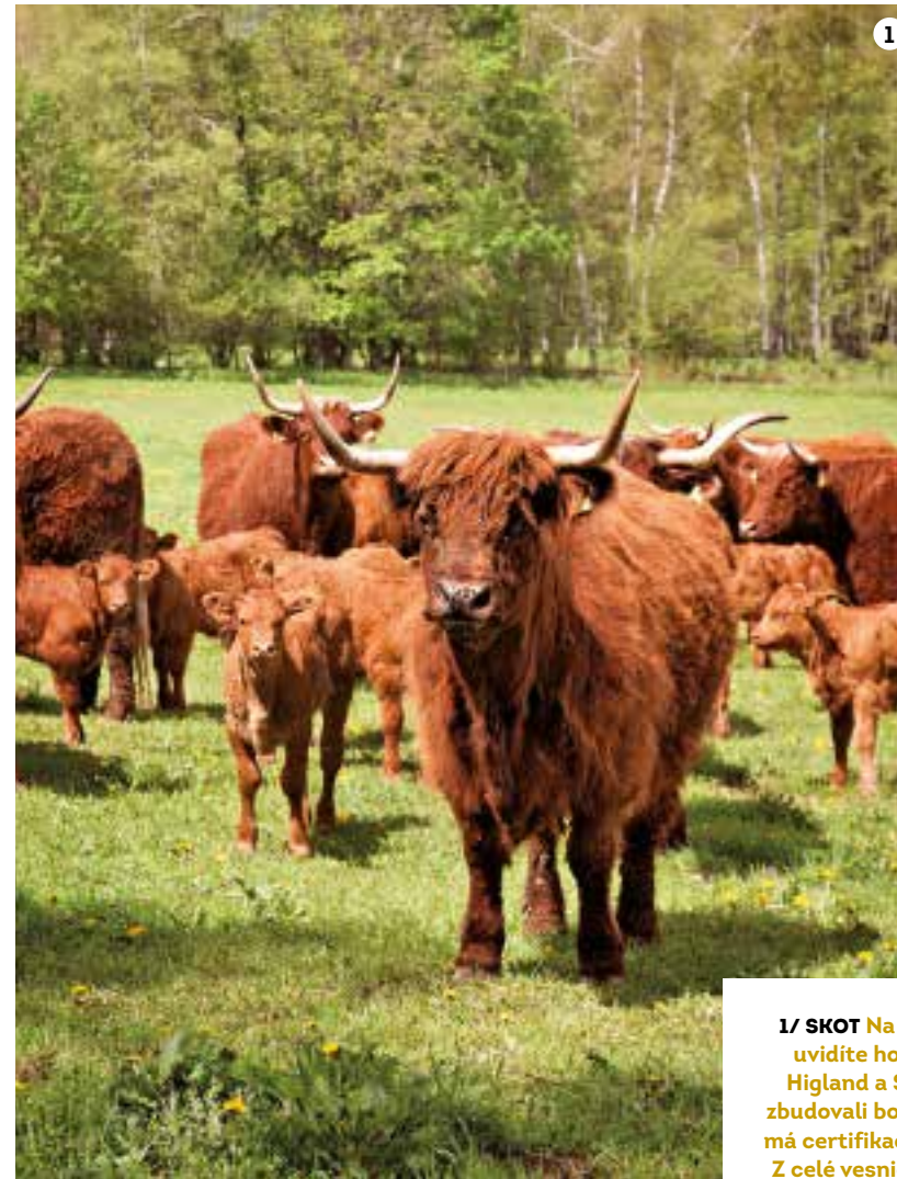
1/ SKOT Na pastvinách v okolí uvidíte hovězí skot plemen Higland a Salers. I kvůli nim zbudovali bourárnu masa, která má certifikaci bio. 2/ POSELSTVÍ Z celé vesnice se zachovala jen budova č. p. 1, kaplička a tato boží muka. 3/ APARTMÁNY Na farmě jich mají šest, každý s plně vybaveným kuchyňským koutem včetně ledničky a vlastního sociálního zařízení, je zde ale i několik pokojků. 4/ TERÉN Pro výslapy i na kole je krajina v okolí jako stvořená.