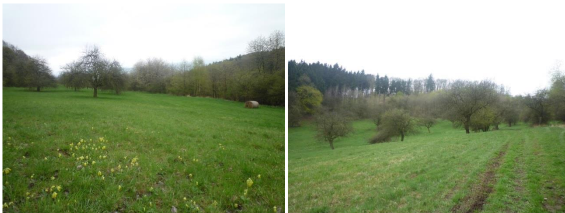
Obr. 3 Příklad krajinnotvorného sadu

V LPIS plocha krajinnotvorného sadu je součástí PB s druhem zemědělsky obhospodařovaná půda. V rámci plochy PB je vlastní plocha krajinnotvorného sadu evidována jako DPB s kulturou jiná trvalá kultura (ne ovocný sad!) a na této ploše je ještě evidován EVP druhu krajinnotvorný sad.