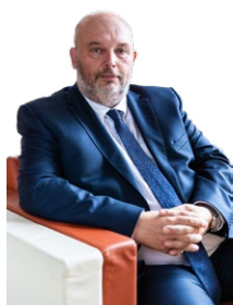
Miroslav Toman ministr zemědělství

Tématem, kterému jsme se poslední lednové pondělí v Bruselu věnovali, byla i takzvaná Zelená dohoda pro Evropu. Ta má představovat zásadní strategii pro přechod do roku 2050 na klimaticky neutrální a udržitelnou ekonomiku bez emisí skleníkových plynů. Záměrem je stanovit ambiciózní cíle EU v oblasti životního prostředí a klimatu tak, aby se spravedlivě zapojily všechny členské státy. Důležité je zvýšit úsilí, prevenci i připravenost v řešení problému ohledně změny klimatu. Udržitelné hospodaření a posílení biodiverzity vnímáme jako hlavní priority, a proto vyšší ambice v oblasti klimatu a životního prostředí podporujeme. Ale úroveň ambicí EU nesmí ohrozit konkurenceschopnost českých zemědělců a omezit výrobu. U nás dojde po roce 2020 k posílení požadavků standardů Dobrého zemědělského a environmentálního stavu půdy, a to především s ohledem na zachování zásob uhlíku a podporu jeho ukládání. Zemědělci budou například muset zachovávat trvalé travní porosty na základě poměru k zemědělské ploše či vhodně chránit mokřady a rašeliniště.