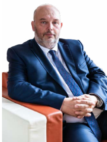
Miroslav Toman ministr zemědělství

To však nestačí. Souběžně musíme budovat i nové vodní nádrže, protože jen při několikaměsíčním suchu zajistí pitnou vodu pro občany. Podzemní zdroje vody nejsou dostačující; kde dříve byly studny hluboké sedm metrů, jsou dnes čtyřicetimetrové. A i v nich se voda ztrácí. Musíme proto co nejvíce obcí napájet na silné, takzvané páteřní vodovody. A ty je třeba napájet z dostatečně silných povrchových zdrojů vody. Jedině tak zajistíme, že města a obce nezůstanou v létě několik měsíců bez pitné vody.