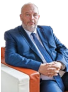
Miroslav Toman ministr zemědělství

To jsou hlavní úkoly, kterým se budeme intenzivně věnovat i v roce 2019. Dovolte mi proto, abych nám všem popřál v nadcházejícím roce optimální počasí, dobrou úrodu a hlavně pevné zdraví.