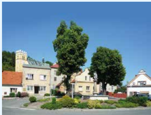
Náměstí Starý Jičín