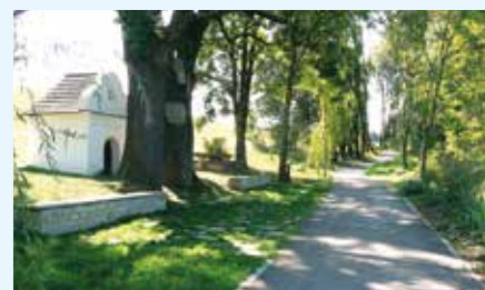
Mariánská vinařská stezka – Břestek

Projekt spolupráce/ projekt realizovaný místní akční skupinou