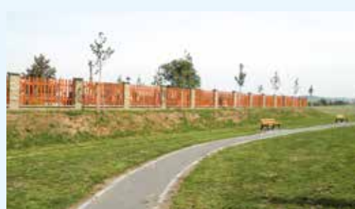
Revitalizace zeleně hřbitova a okolí