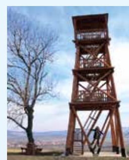
Rozhledna na Skalce u Bojkovic