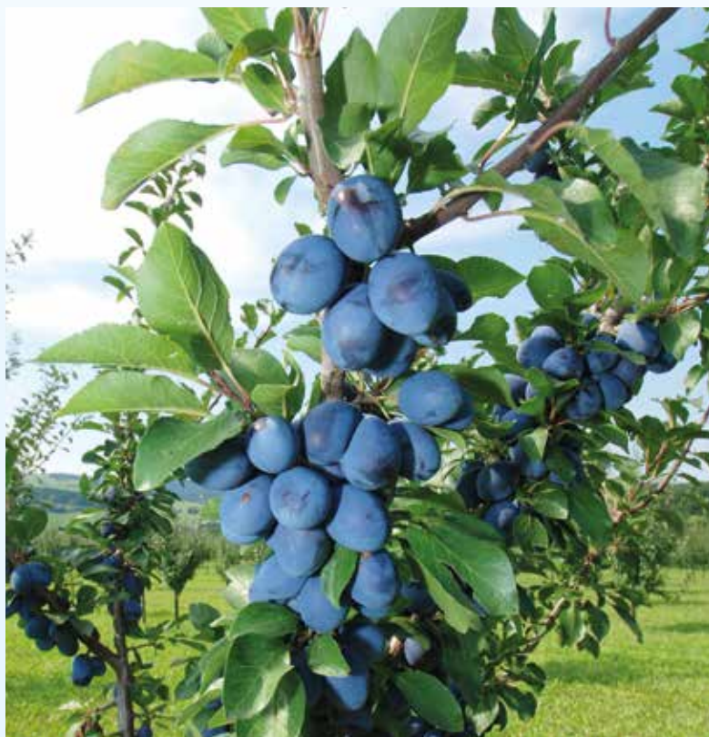
Ovocný strom, trnka