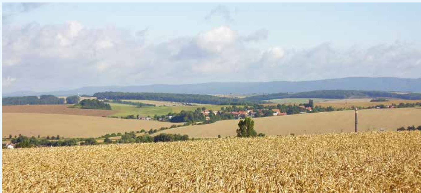
Krajina MAS - Partnerství Moštěnka