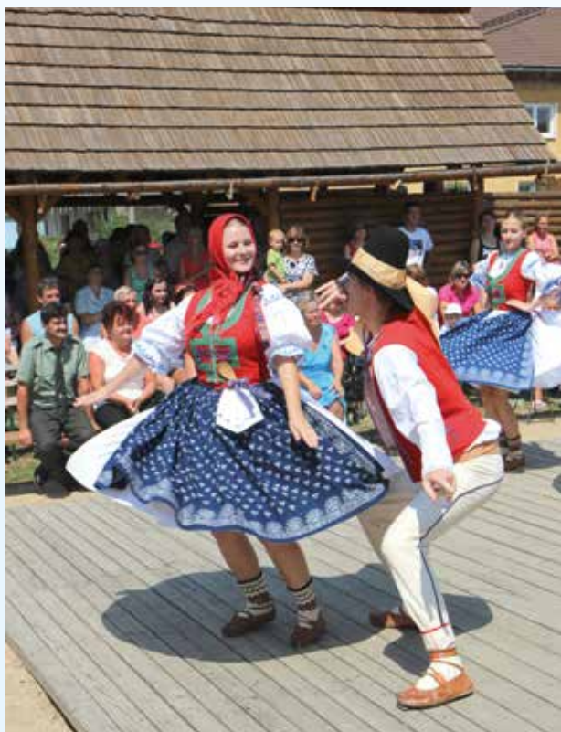
Informační dvůr, místo pro veřejné setkávání lidí a folklorních souborů