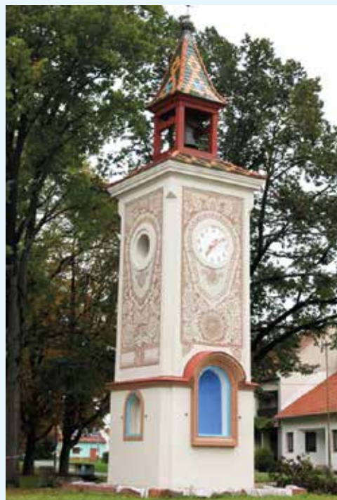
Zvonice na Ostrožském Předměstí