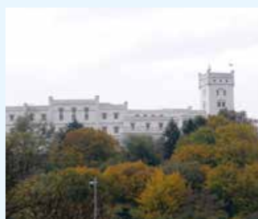
Zámek Nový Světlav