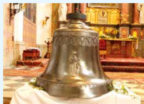
Zvon v kostele sv. Jiljí