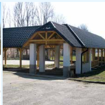
Zastřešení veřejného prostranství