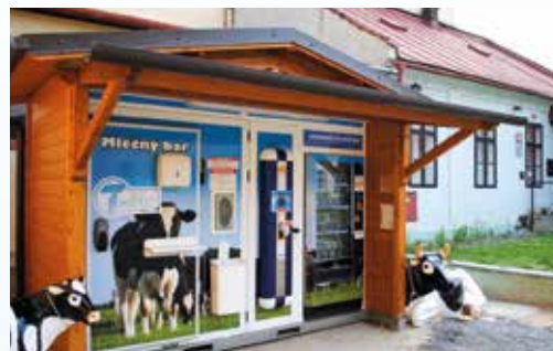
Automat na výdej mléka