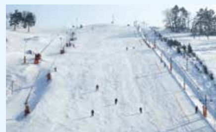
Lyžařský areál Stupava

Projekt neziskové organizace: Záchrana kostela v Boršicích - I. etapa - oprava střechy