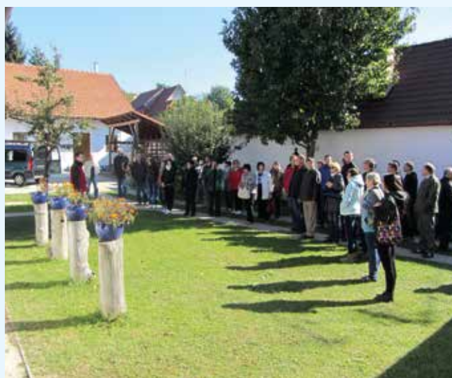
Projekty v Programu rozvoje venkova v praxi – odborný seminář – 4. 10. 2013