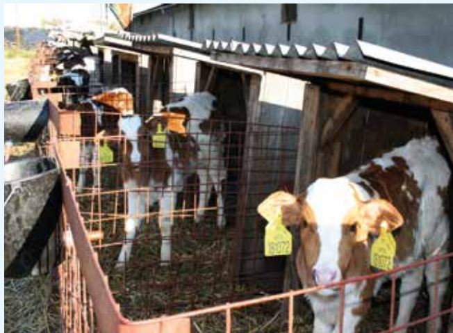
Zlepšení welfare v chovu telat