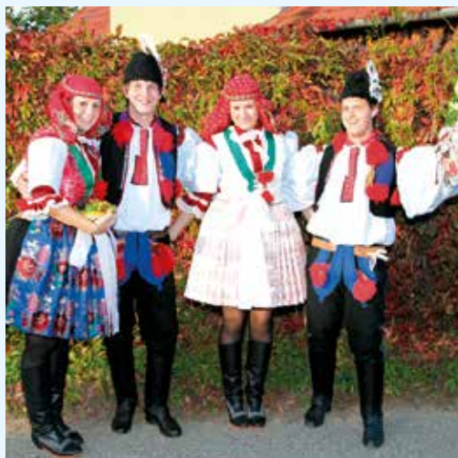
Krojové vybavení, SPOT Slunéčko