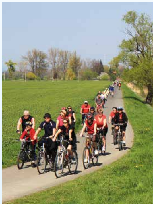
Cyklostezka podél Bažova kanálu

Vznik MAS: 2012 Počet obcí v regionu: 8 Počet obyvatel: 2,1 obyvatele/ha Rozloha: 60256 ha Počet členů MAS: 18 Sídlo: Nám. Hrdinů 100, 686 03 Staré Město