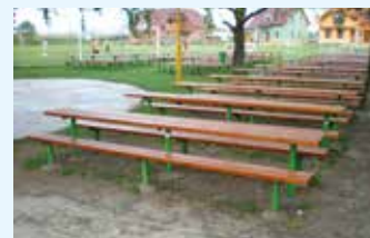
Sportovní areál Sušice