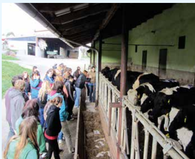
Realizované projekty PRV ve Zlínském kraji – exkurze studentů SŠZePř Rožnov pod Radhoštěm – 1. 11. 2013