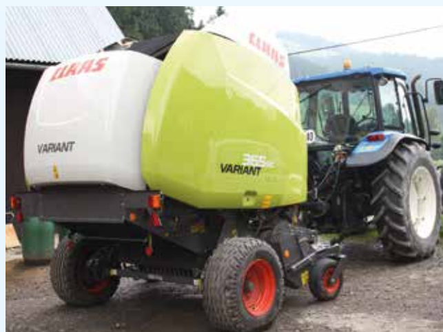
Lis na seno