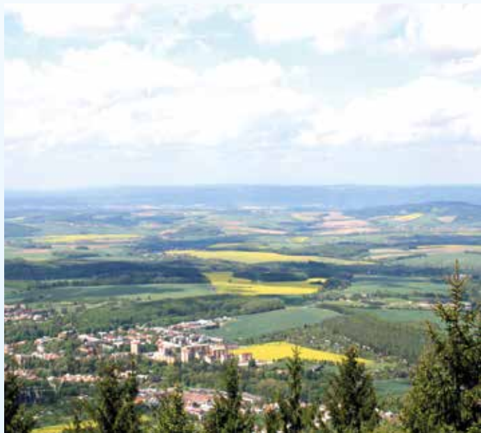
Letecký pohled Bystřice pod Hostýnem