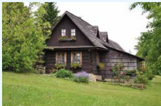
Původní chalupa na pasekách