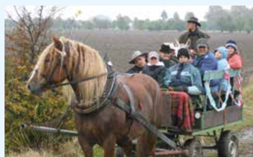
Po formanských stezkách