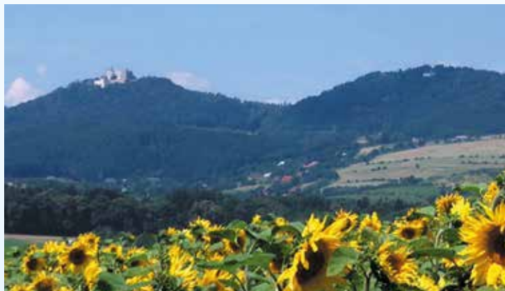
Hrad Buchlov a okolí

Vznik MAS: 2004 Počet obcí v regionu: 14 Počet obyvatel: 12 734 Rozloha: 154 km 2 Počet členů MAS: 30 Sídlo: Nám. Svobody 800, 687 08 Buchlovice Webové stránky: www.buchlov.cz