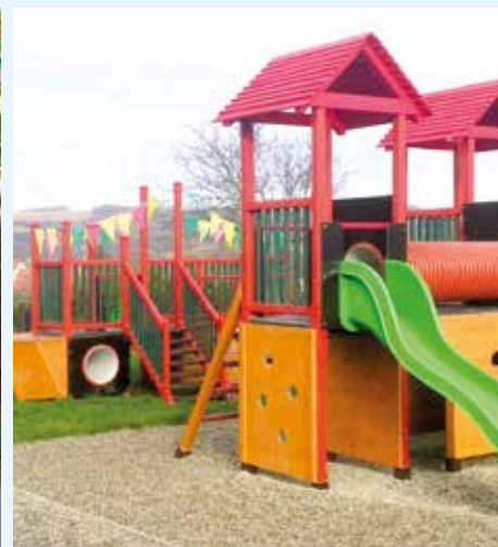
Dětské hřiště v obci Podolí