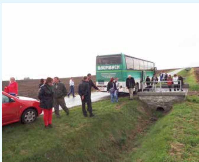
Realizace prvků společných zařízení v rámci pozemkových úprav ve Zlínském kraji (podpořených z PRV) – odborná exkurze – 24. 10. 2013