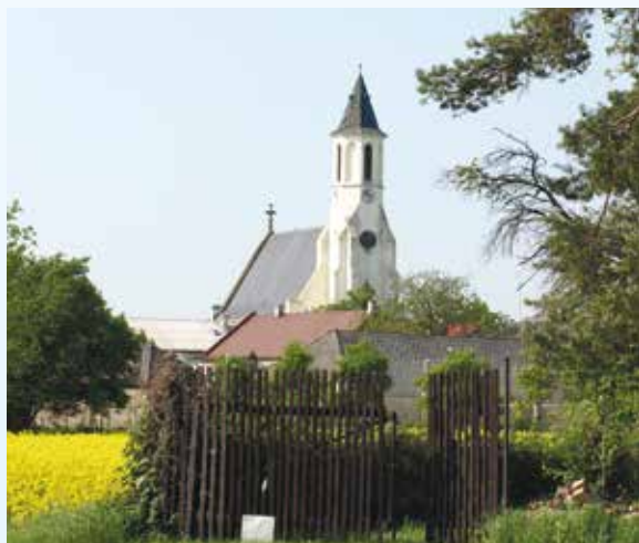
Novogotický kostel sv. Floriána v Bochoři