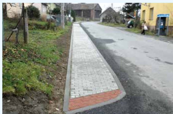
Chodník v obci Loučka