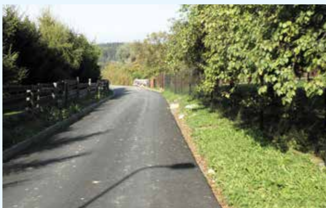
Komunikace v obci Police