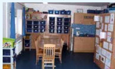
Zázemí občanského sdružení v Senince

Projekt neziskové organizace: Vybudování provozního zázemí občanského sdružení v Senince