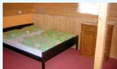
Rekonstrukce vybavení penzionu Severka