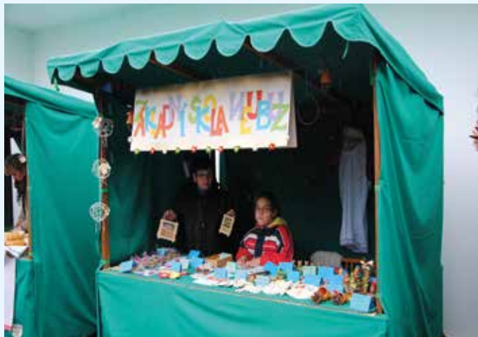
Technická výbava pro lepší propagaci v mikroregionu