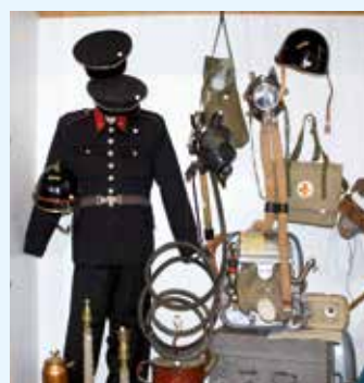
Expozice „Historie požární ochrany“