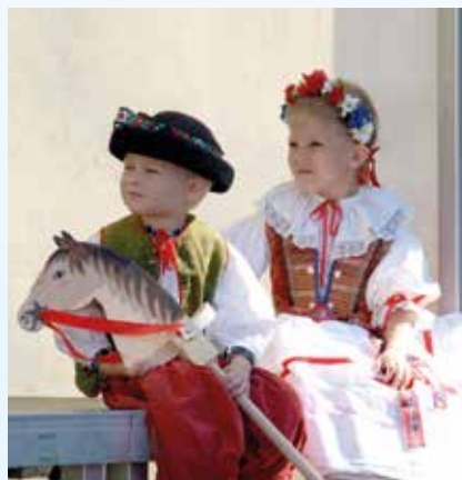
Dětský hanácký kroj