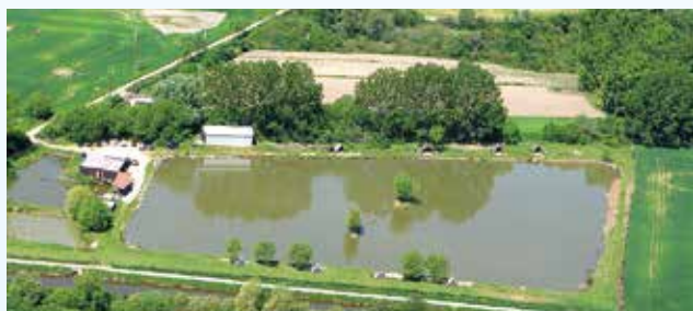
Rybník - mokřad Huštěnovice

Vznik MAS: 2007 Počet obcí v regionu: 16 Počet obyvatel: 39 868 Rozloha: 15 037 ha Počet členů MAS: 40 Sídlo: Kudlovice 39 Webové stránky: www.masschp.cz