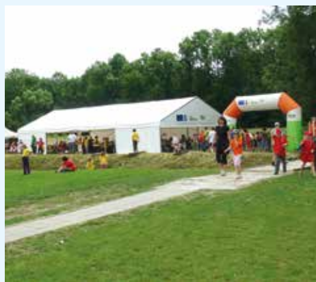
Kraj pod Hostýnem ožívá