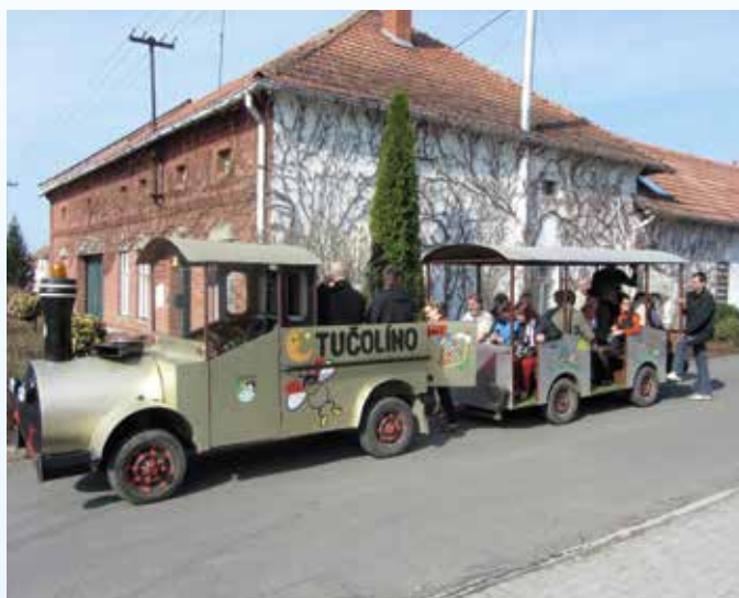
Motivační seminář k soutěži Vesnice roku 2013 – 18. 4. 2013