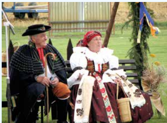
Hospodář a hospodyně ve svátečním hanáckém kroji