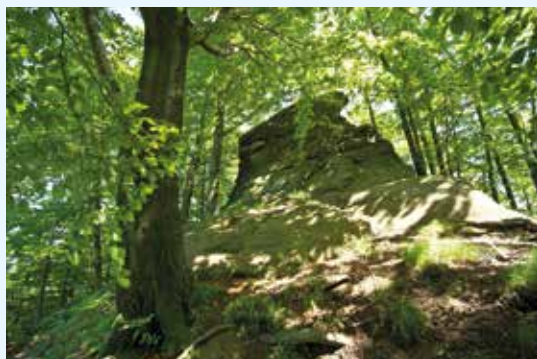
Naučná stezka Klenov

Cílem tohoto projektu je zejména získání dovedností a zkušeností za účelem vytvoření aktivního místního partnerství. Příprava podkladů pro zpracování Integrované strategie území s aktivním zapojením nejen členských obcí, ale také se zapojením neziskového a podnikatelského sektoru. Osvojení činností spojených s běžným provozem MAS, propagace MAS SV a zvýšení povědomí o MAS na území členských obcí a příprava místního partnerství na nové programovací období 2014–2020.