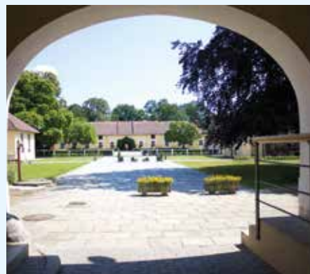
Zemský hřebčinec Tlumačov