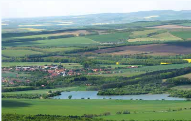
Vodní nádrž Ordějov

Vznik MAS: 2005 Počet obcí v regionu: 12 Počet obyvatel: 37 679 Rozloha: 253,55 km 2 Počet členů MAS: 29 Sídlo: Suchá Loz č.p. 72, 687 53 Suchá Loz Webové stránky: www.masvychodnislovacko.eu