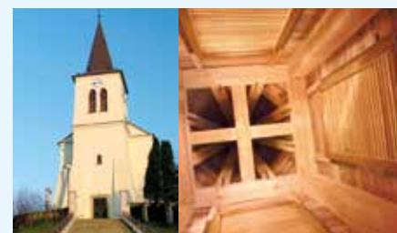
Kostel v Boršicích u Buchlovic

Projekt obce/města: Mariánská vinařská stezka Břestek - Buchlovice