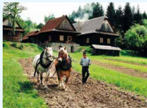
Typický život na Valašsku