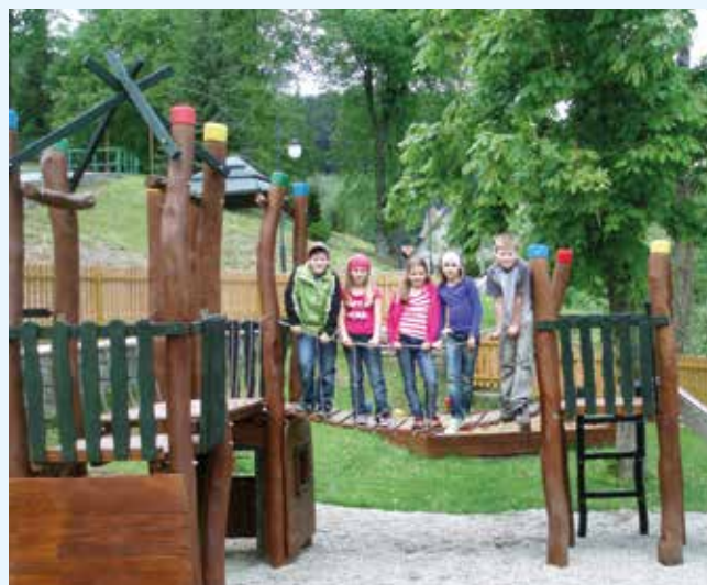
Školní zahrádka v obci Zděchov