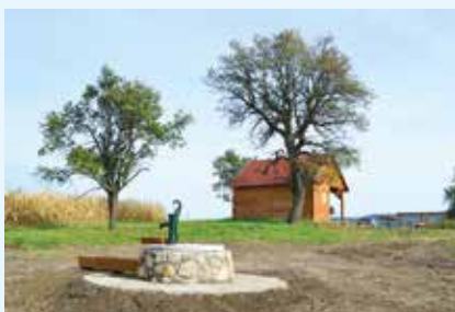
Studna na Rozárově