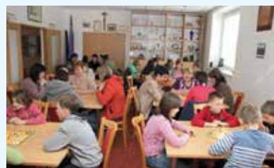
Hasičské komunitní centrum Lačnov

Projekt obce/města: Vybavení hasičského komunitního centra Lačnov