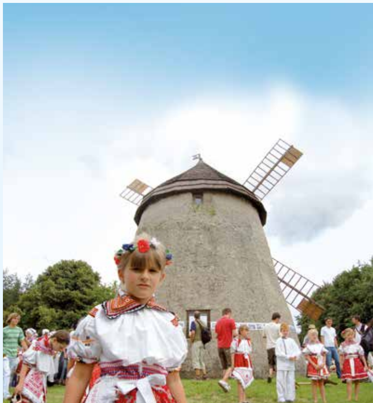
Větrný mlýn Kuželov