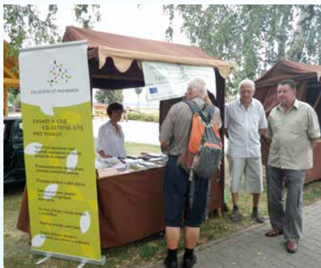
TOP Víno Slovácka 2013 – prezentace CSV – 24. 8. 2013