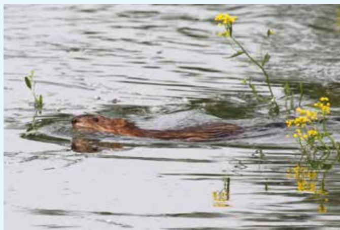
Řeka Morava, vydra