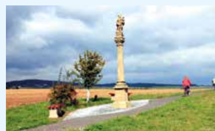
Mariánská vinařská stezka – Buchlov