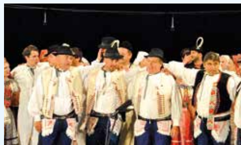
Krojové vybavení folklorního souboru Suchovjan