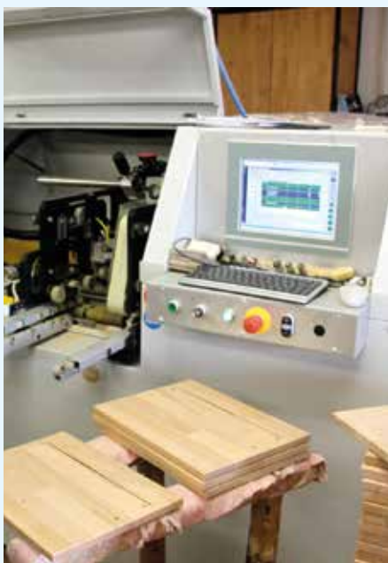
CNC obráběcí stroj