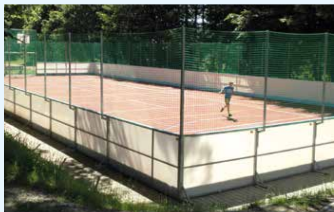
Antukový kurt v obci Branky