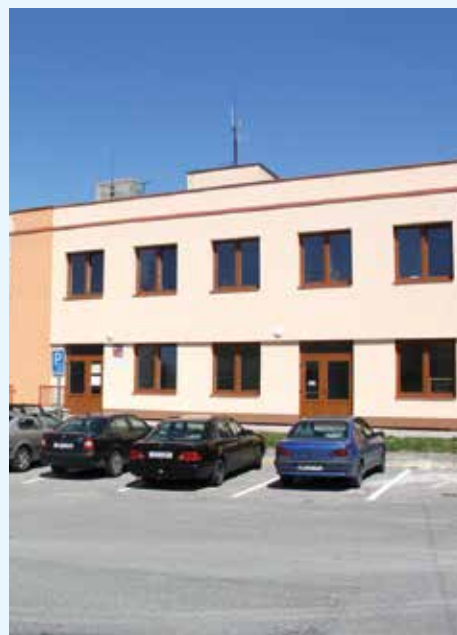
Obecní dům v Bystřici pod Lopeníkem