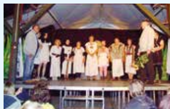
Společenský život na Košíkách