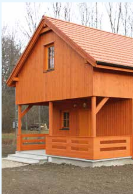
Skautská klubovna Suchá Loz