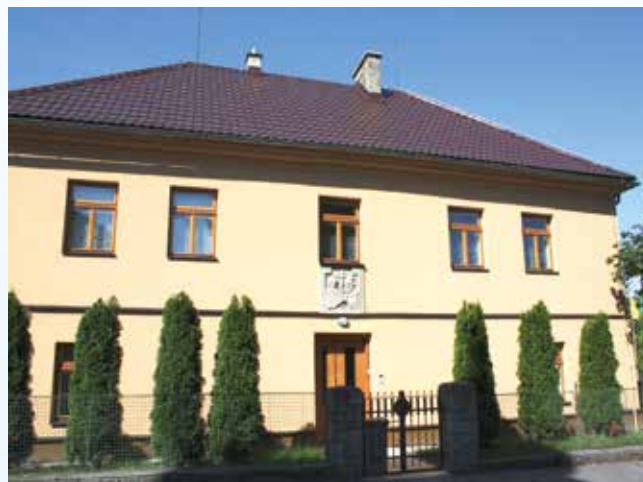
Budova fary v Halenkově