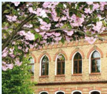
Základní škola Břest

V roce 2013 byla schválena Žádost o dotaci z Programu rozvoje venkova – Opatření III.4.1 Získávání dovedností, animace a provádění.