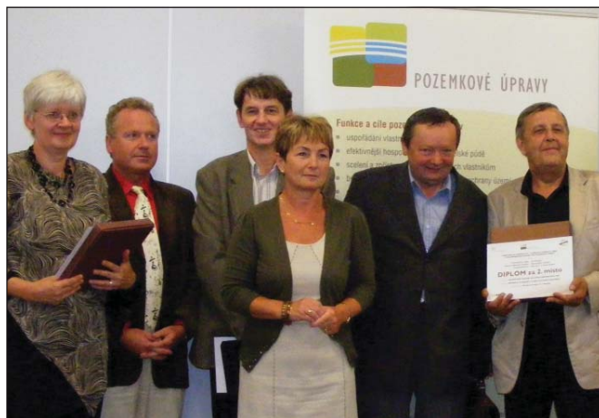
Ilustrační fotografie ze slavnostního vyhlášení výsledků soutěže

Ani předávání cen vítězům letos neprobíhalo na celostátní konferenci pozemkových úřadů, jak bylo zvykem. Ceny byly předány na odborném semináři pořádaném Spolkem pro obnovu venkova na výstavě Země Živitelka.