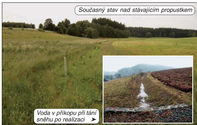
Současný stav nad stávajícím propustkem