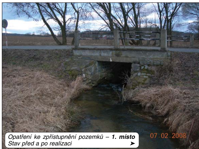
Opatření ke zpřístupnění pozemků – 1. místo 07.02.2008 Stav před a po realizaci