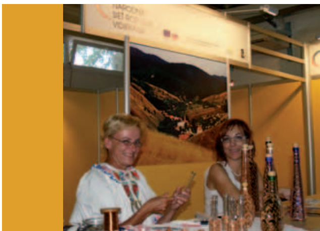
Poprvé se na letošní výstavě představili hosté ze Slovenska

sítě pro venkov a Národní sítě MAS ČR, spolu se Spolkem pro obnovu venkova, se podařilo výrazně zlepšit úroveň prezentace českého venkova. Pavilony venkova R1 a R3 byly přehlídkou více než padesáti Místních akčních skupin z celé České republiky. Návštěvníci měli možnost vidět expozici Ministerstva pro místní rozvoj a bohaté zastoupení Ministerstva zemědělství. Poprvé se představila na letošní výstavě Národní síť rozvoje vidieka SR a místní akční skupiny ze Slovenska. Celý pátek, druhý den výstavy, byl ve znamení venkova, což bylo podpořeno množstvím pozoruhodných akcí v obou uvedených pavilonech i na volných plochách. Den českého venkova byl zakončen společenskou akcí „Večer venkova.“