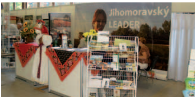
... včetně prezentací více než padesáti místních akčních skupin