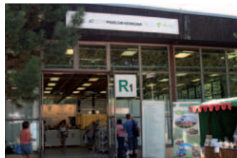
R1 - jeden z pavilonů venkova

byla letos na výstavě oproti předchozím letům opravdu silně zastoupena. Byla zde vidět celá řada expozic, které reflektují nejnovější trendy související s životem a prací na venkově a v jednotlivých regionech. Prostřednictvím Ministerstva zemědělství, Celostátní